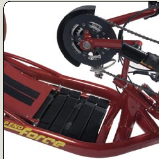
Posición del asiento y tapizado fáciles de ajustar.