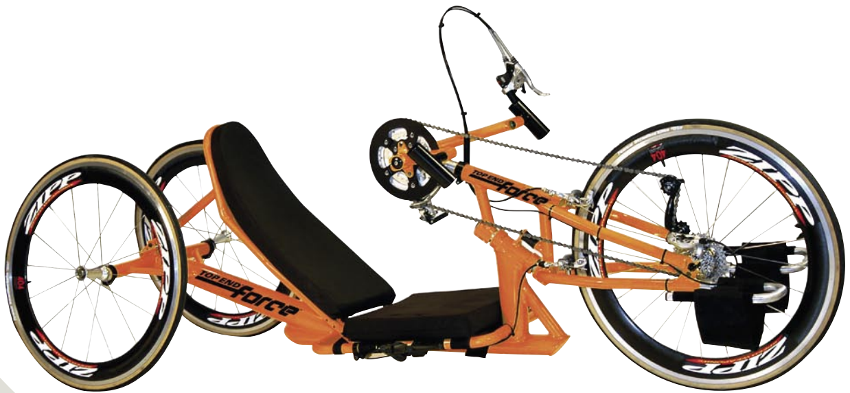
Invacare® Top End® Force

Si quieres competir y te sientes ganador, con los modelos Invacare® Top End® Force, Force G o Force R , tienes la bicicleta de mano que esperabas. Con su diseño aerodinámico, una posición super reclinada y su chasis fuerte y reforzado, nadie te podrá ganar.